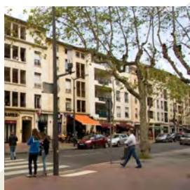
Le Point du Jour