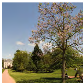
Le Parc de la Mairie